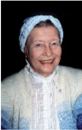
SIMONE DE BEAUVOIR