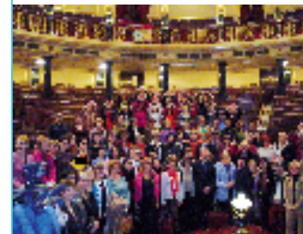
CELEBRACIÓN DE LA APROBACIÓN DE LA LEY DE VIOLENCIA DE GÉNERO.