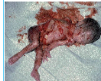
«INTERRUPCIÓN DEL EMBARAZO»

Sexismo, feminismo y machismo , son términos que preparan psicológicamente al lector para aceptar la teoría de la «lucha de clases» entre los sexos, que la ideología de género sustenta haber sido la clave que ha caracterizado toda la injusta historia de la Humanidad hasta la actual liberación, que ella preconiza.